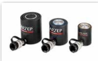
Cilindros Simple Efecto, Baja Altura, SP.